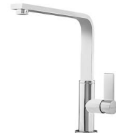
Mitigeur NYC 8486 000