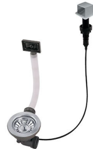
Vidange automatique LIRA 8407 103